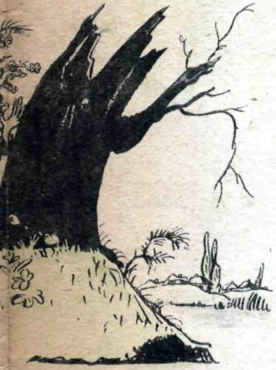
е наши не были. машь, Фриц? а петуха из деревни.