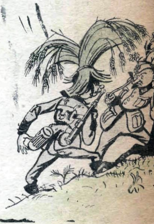
Рис. Б. Фридкина

— В этой деревне — Почему ты ду — Я слышу пени