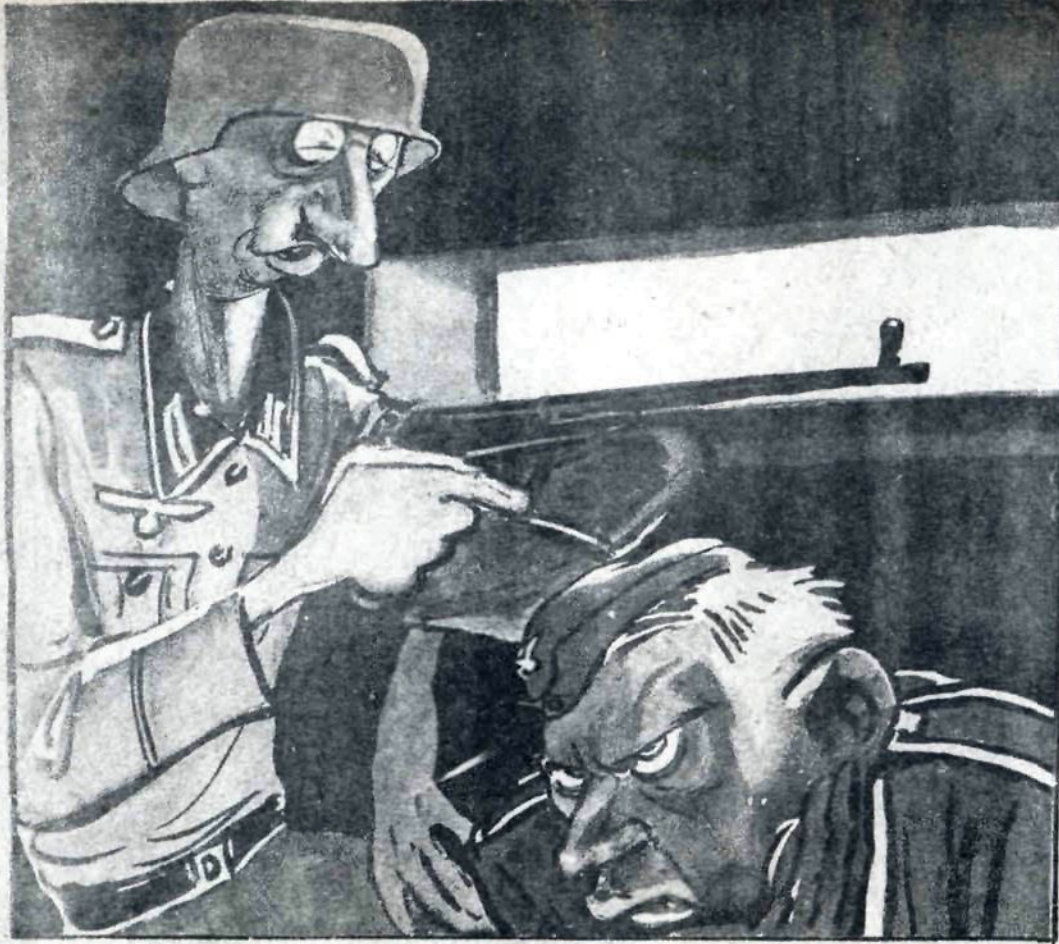
Рис. К. Елисева

— Почему ты так дрожишь, Шульц? — Понимаешь, почему-то земля дрожит от русской артиллерии, вот и я с ней 'дрожу за компанию.