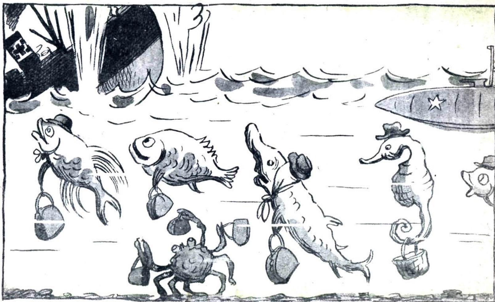
НА ДНЕ БАРЕНЦОВА МОРЯ . — Опять сегодня немца будут выдавать!.