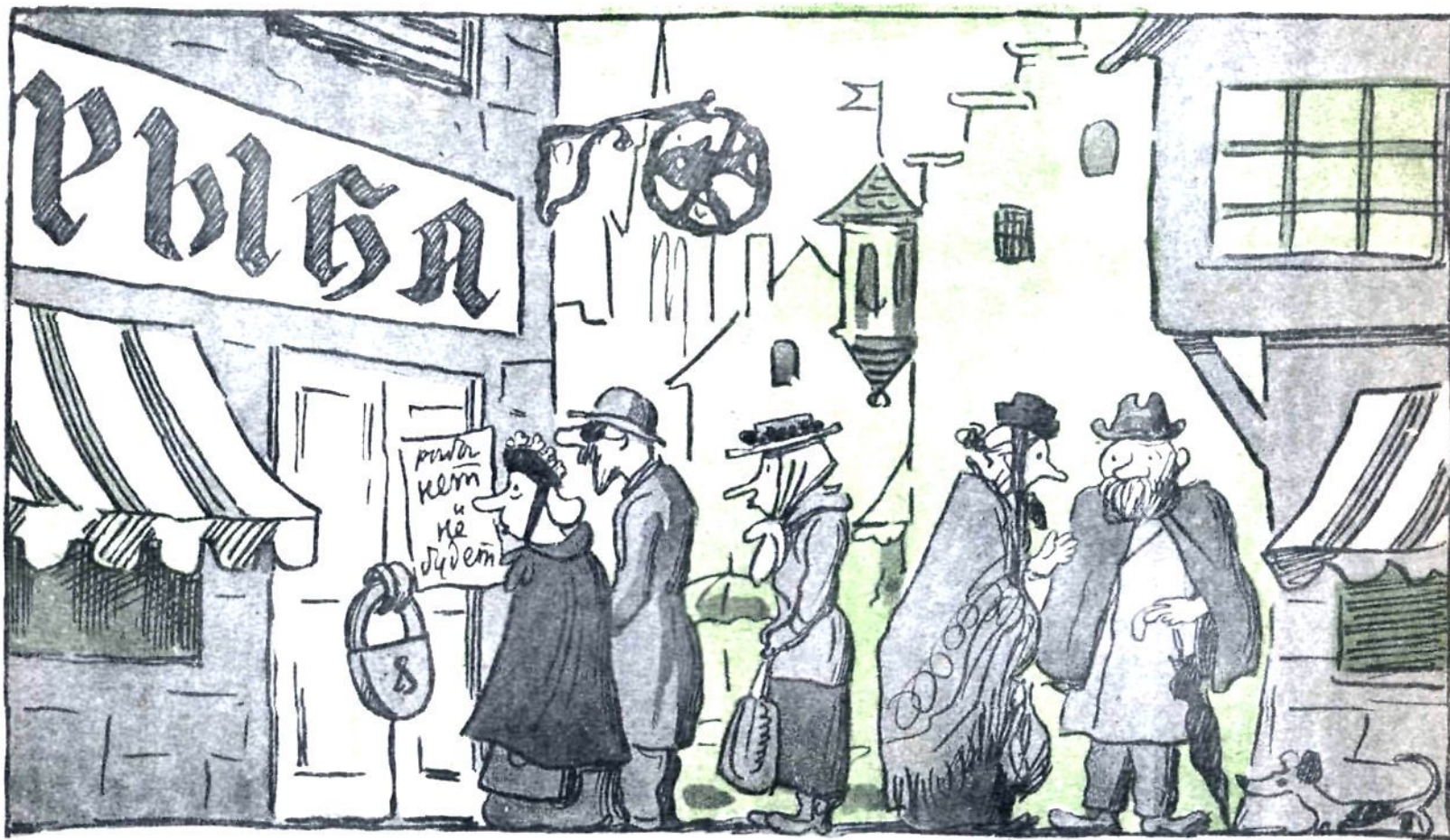
В НЕМЕЦКОМ ГОРОДЕ — Опять рыбы нет!..