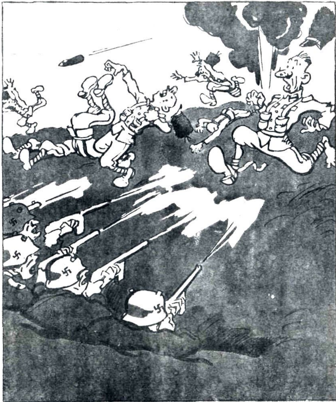
«Отступление 7-й венгерской дивизии доблестно отбито нашими частями».