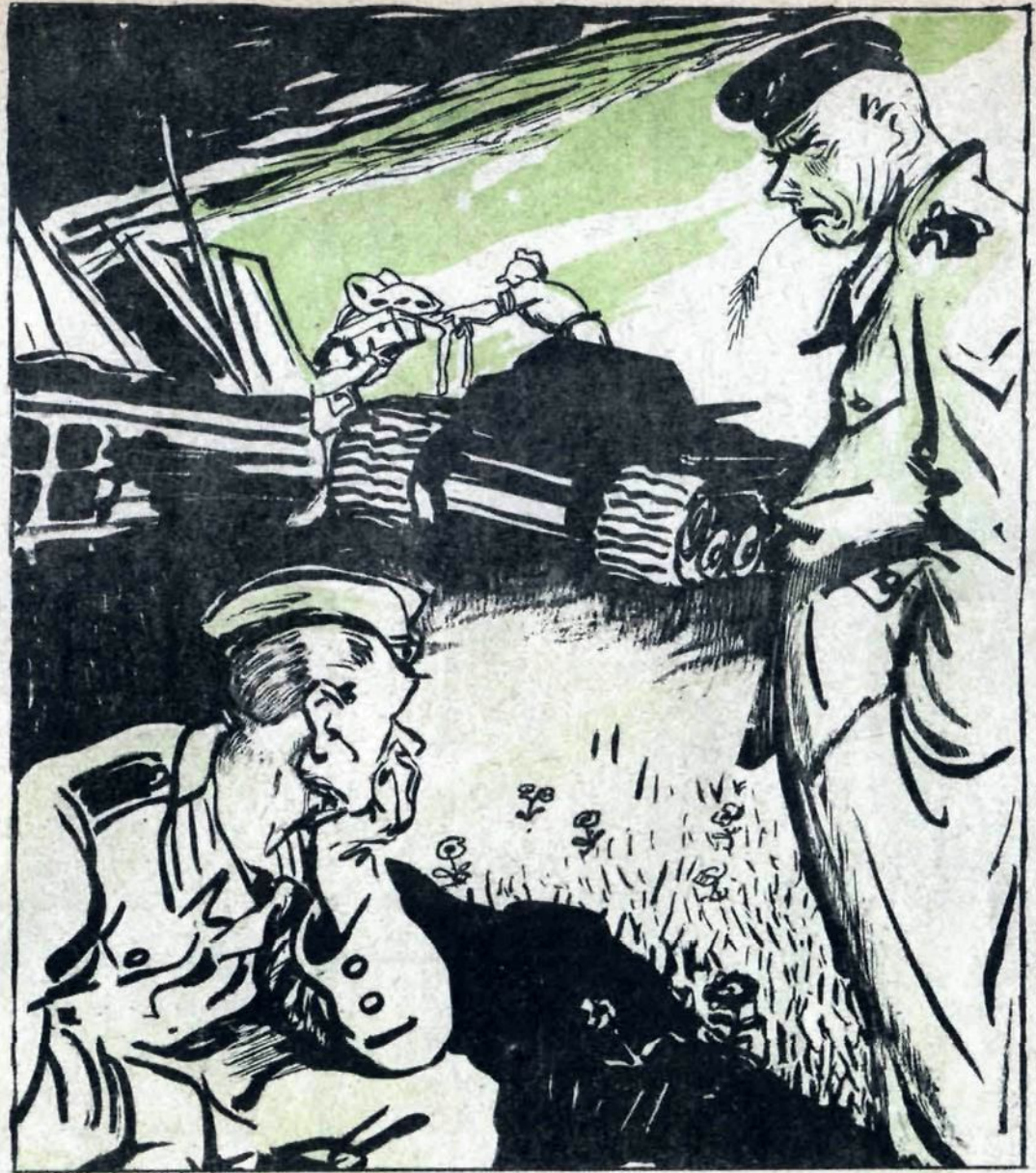
— Послушай, Ганс, говорят пехоте больше всего достается? — Какой там! Самое ценное забирают танкисты...

КОМАНДИР: — И наблюдательность! Мих. ЗОЩЕНКО